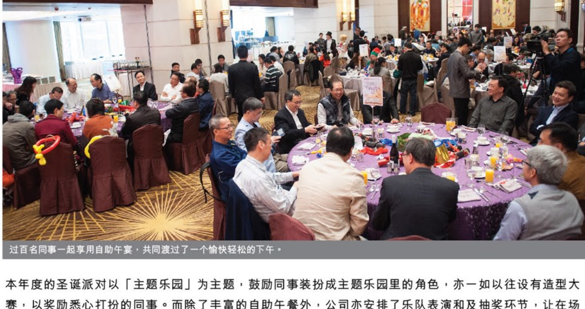
过百名同事一起享用自助午餐，共同渡过了一个愉快轻松的下午。

本年度的圣诞派对以「主题乐园」为主题，鼓励同事装扮成主题乐园里的角色，亦一如以往设有造型大赛，以奖励悉心打扮的同事。而除了丰富的自助午餐外，公司亦安排了乐队表演和抽奖环节，让在场同事共同渡过了一个愉快轻松的下午。