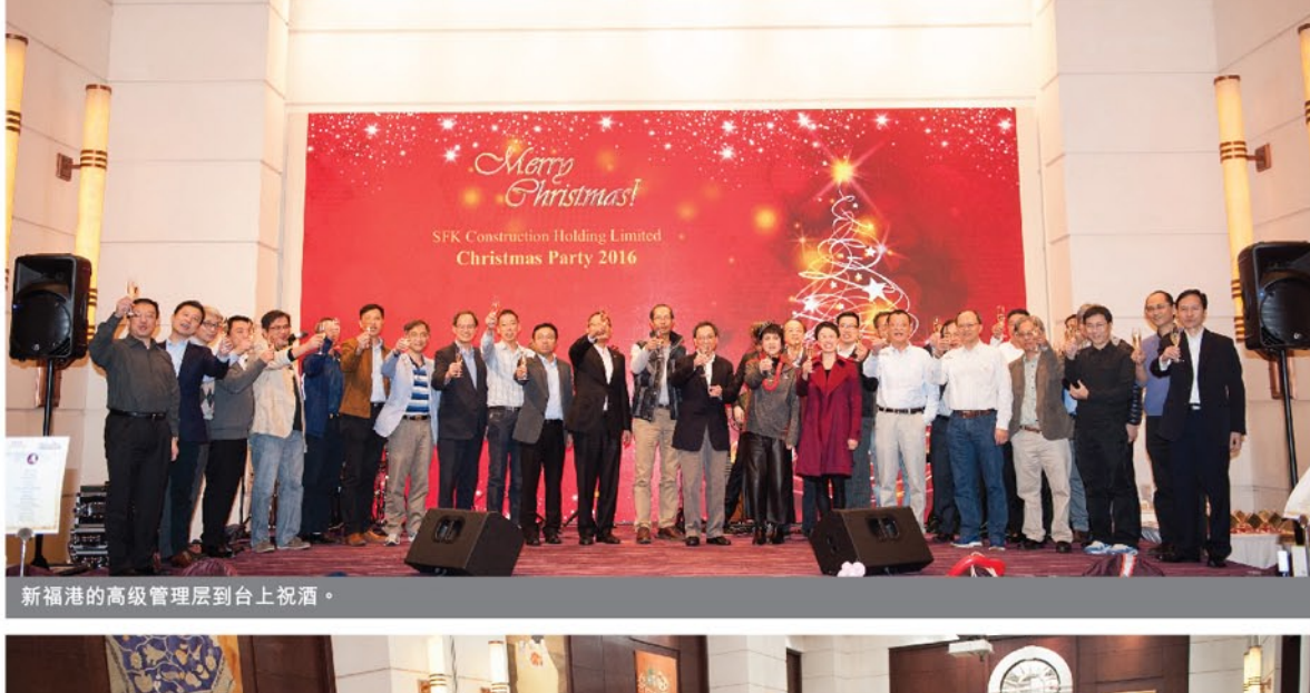
新福港的高级管理层到台上祝酒。

为庆祝圣诞节来临，新福港于2016年12月23日在康得思酒店举办「主题乐园」圣诞派对，全场共有过百名香港及国内的同事参与，场面热闹。