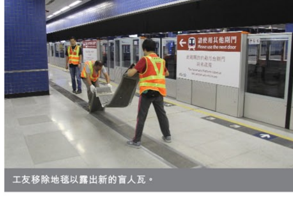
工友移除地毯以露出新的盲人瓦。