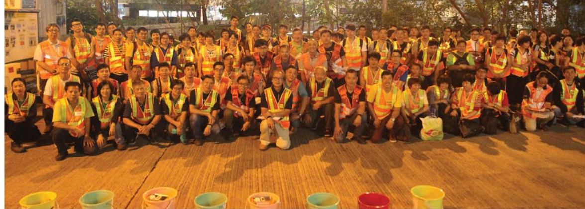
约90名参与是次延伸工程的新福港及分包商员工大合照。

负责月台延伸部分工程的新福港联营公司，于11月19日晚至20日凌晨，成功完成多项工作，包括移除月台围栏、贴上盲人瓦及清洁工作等。约90名新福港及分包商员工于19日晚10时到达港铁石码站。负责人向工友进行分组简报后，各组工友随即分派到达马鞍山线沿线9个车站的月台开展工程。所有工作于翌日凌晨5时顺利完成。