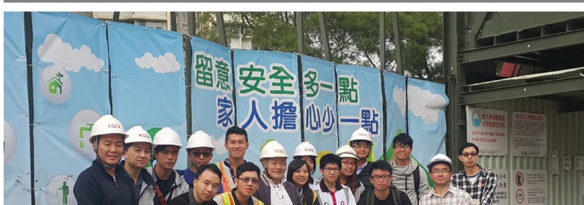
是次考察活动的所有参加大合照。

由新福港担任主承建商的「常乐街居屋发展计划」已于2015年2月26日动工，预计于2019年初完成。工程主要包括拆卸现有建筑物、加强现有的土钉墙、地盘平整、建造挡土墙、地下公用设施、三栋住宅单位（A座及C座合共27层，B座26层，共280个住宅单位）及两层的半地下停车场。现阶段，工程主要进行加强现有土钉墙、拆卸现有建筑物、地盘平整、钻孔桩及住宅单位B座的柱桩帽的部分。