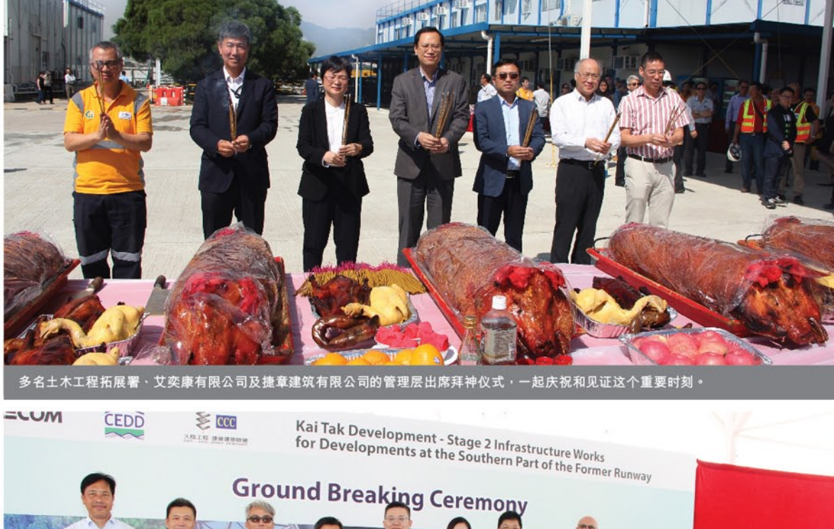
多名土木工程拓展署、艾奕康有限公司及捷章建筑有限公司的管理层出席拜神仪式，一起庆祝和见证这个重要时刻。

由大陆工程—捷章建筑联营承建的「合约编号：KL/2014/01 - 启德发展计划—前跑道南面发展项目的基础设施工程第二期」于2016年11月14日举行一个简单的动工仪式。多名土木工程拓展署、艾奕康有限公司及大陆工程—捷章建筑联营公司的管理层均有出席，一起庆祝和见证这个重要时刻，并诚心祝愿工程一切顺利。