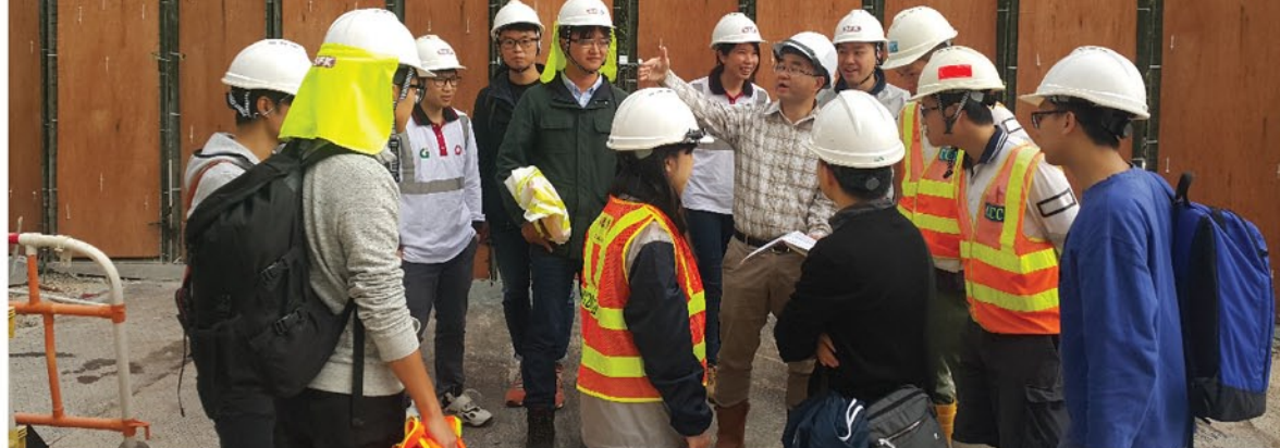
参加者实地考察工地。

为加强员工的专业知识，新福港于2016年12月3日举办项目考察。来自不同项目的19名新福港员工到香港房屋委员会项目 - 「常乐街居屋发展计划」的工地实地参观，获益良多。