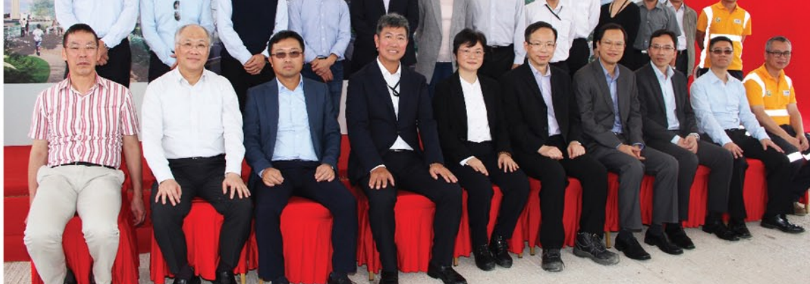
多名土木工程拓展署、艾奕康有限公司及捷章建筑有限公司的管理层大合照。

是项工程已于2015年11月30日展开，预计于2017年年底至2019年间分阶段完成。工程范围包括在前启德跑道兴建道路、高架园景平台、隔音屏障、行人路、步行街、街道照明、交通辅助设施、排水系统、污水系统、水管、环境美化和附属工程等。